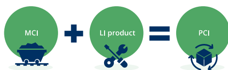
Figuur 6: Bepaling van de PCI

De MCI- en de LI-score vormen samen de Product Circularity Index (PCI). De PCI-score representeert de circulaire potentie van een product als het in een bouwwerk gemonteerd is. De PCI-score wordt uitgedrukt tussen 0% en 100%, waarbij 0% volledig lineair en 100% volledig circulair is.