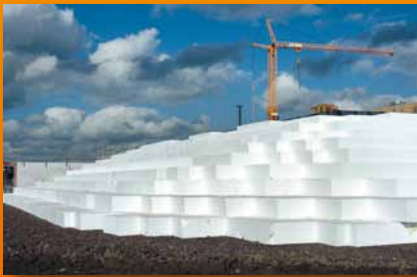
algemene toepassingen (bijvoorbeeld GWW)