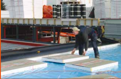
plat dak isolatie